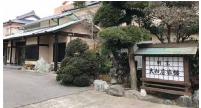
—ずいぶん由緒のある旅館なんですね。

五代目文代が千葉銀行員宣夫を迎え、六代目私と祖母と三代揃っての営業は、右肩上がりの好況に乗り