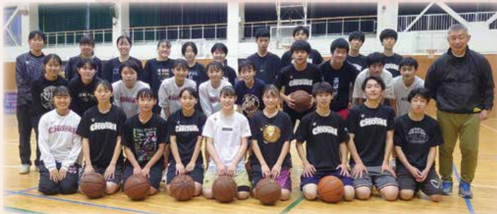
バスケット部 インタビュー記事は24ページにあります