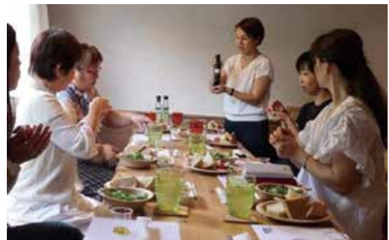
茂原市出身 2016年 株式会社A.K.Bloom起業 オイルソムリエとしてオイルセレクトショップを開業

食に限らず、背景を知ることで作った人に感謝ができ、簡単には残したり捨てたりできずに大切にしようと思える。人それぞれの価値は違うし、大量生産品が必要なこともあります。そこにストーリーもあると思うので否定はしません。が、量販店に大量に並んでいる「エキストラバージンオリーブオイル」は大概が偽物です。日本はIOCに未加入ですから。